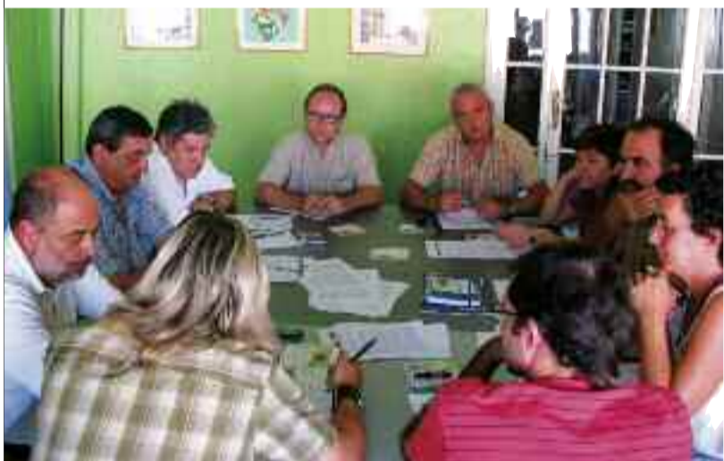
Membres de les tres Intersindicals reunits a Barcelona el 10 de setembre

Les tres organitzacions sindicals reclamen l'establiment de marcs de relacions laborals propis